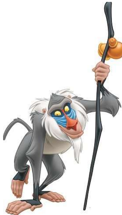
Rafikijev štap, Lion King

Primer rekvizita (gedžeta) iz slavnog animiranog crtanog filma: